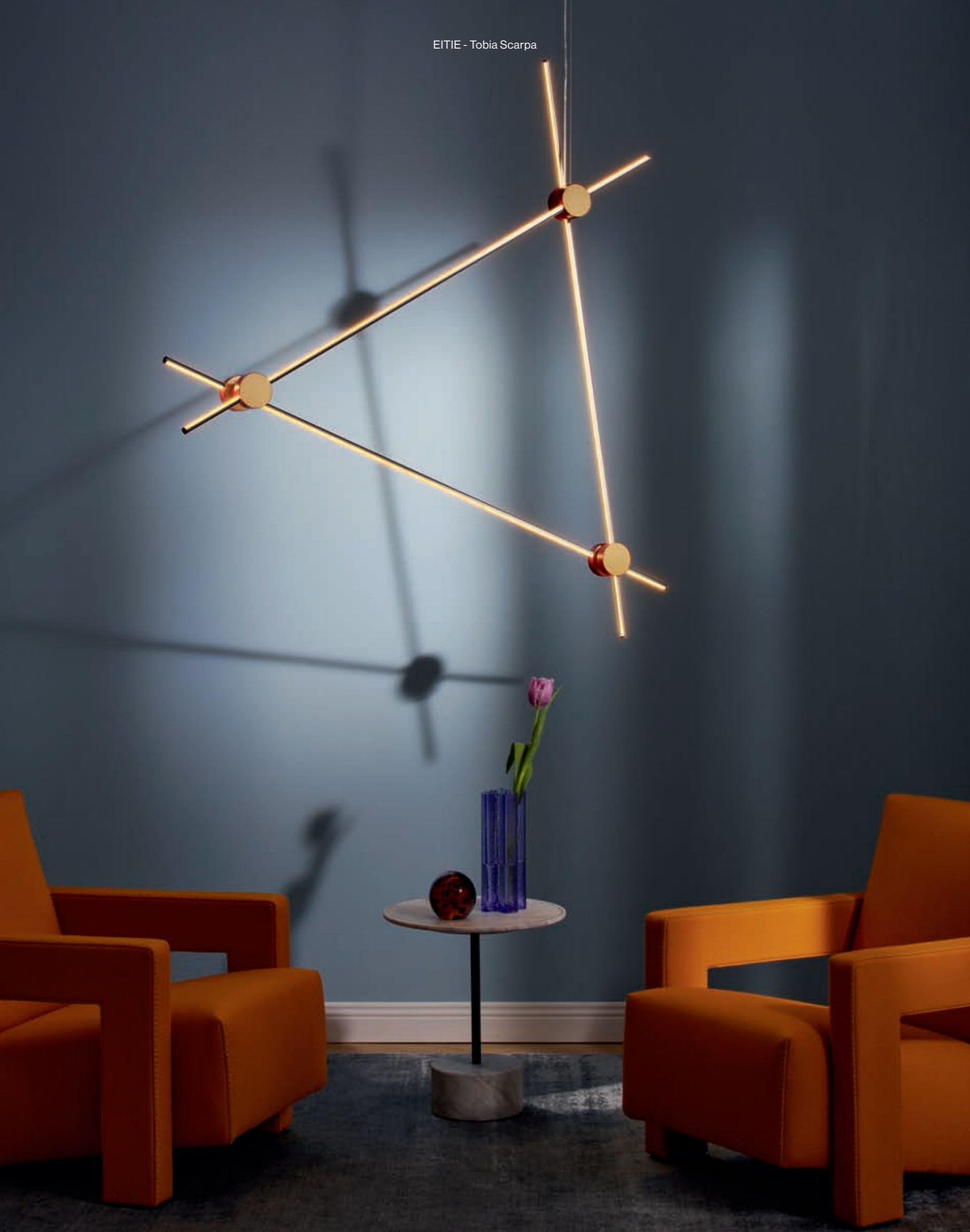
EITIE - Tobia Scarpa