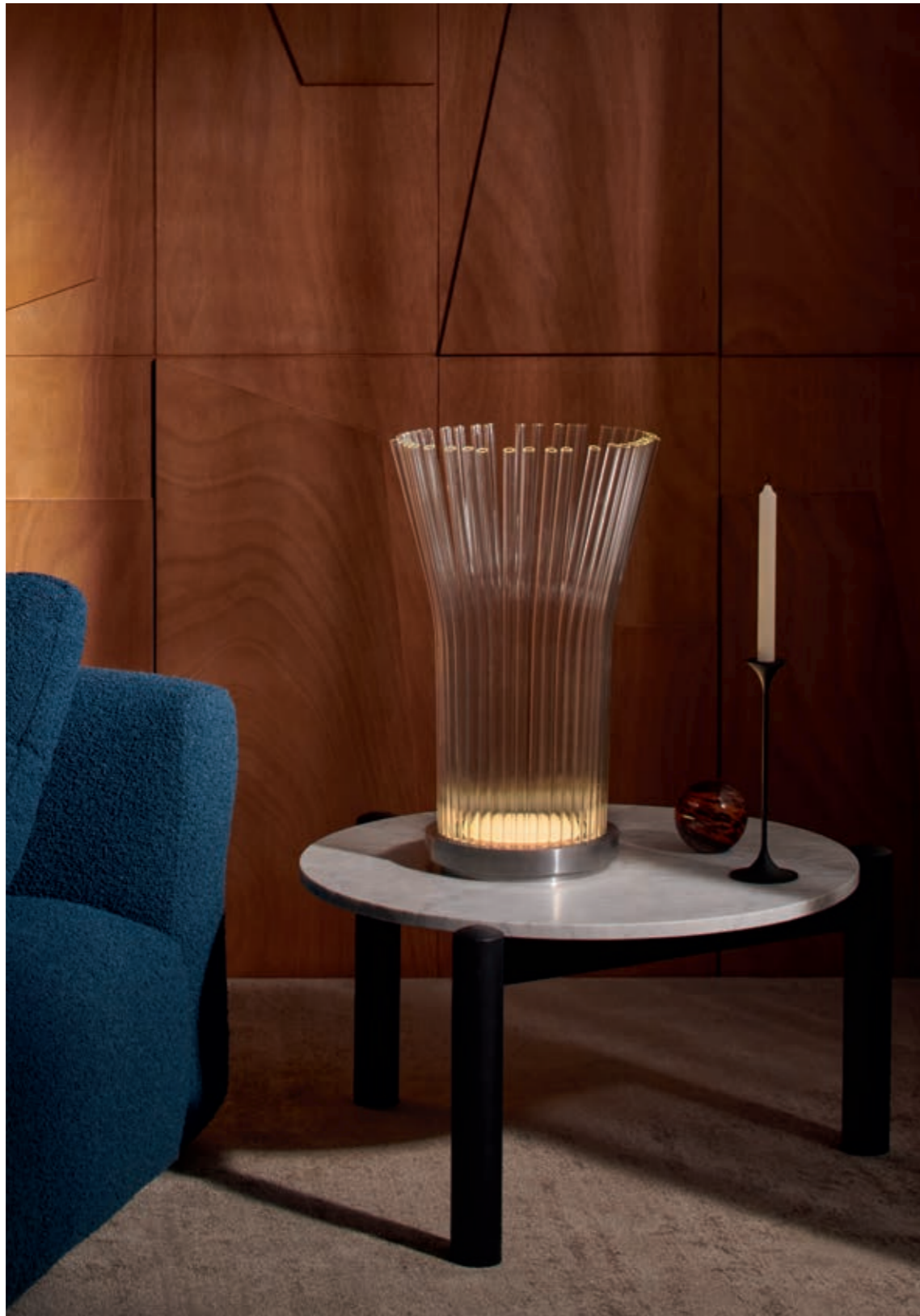
FLUXUS-E, Paolo Ulian