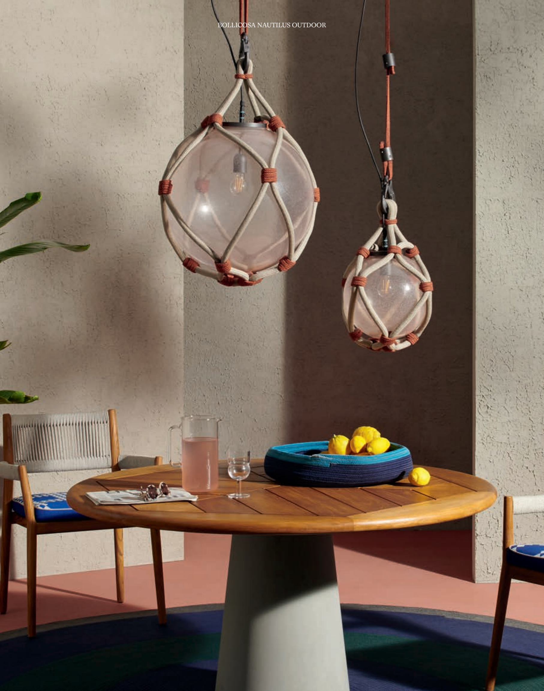
BOLLICOSA NAUTILUS OUTDOOR